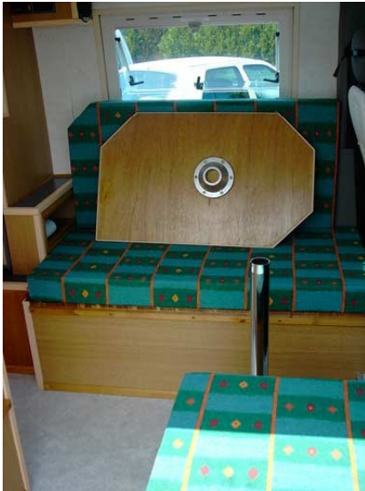
Banquette et pouf – Montage table

Repas : Dînette latérale gauche avec table de 90x55 sur pied colonne et un pouf en face. Eclairage par pavé fluo.