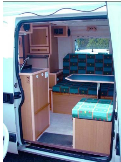
Vue de la porte latérale