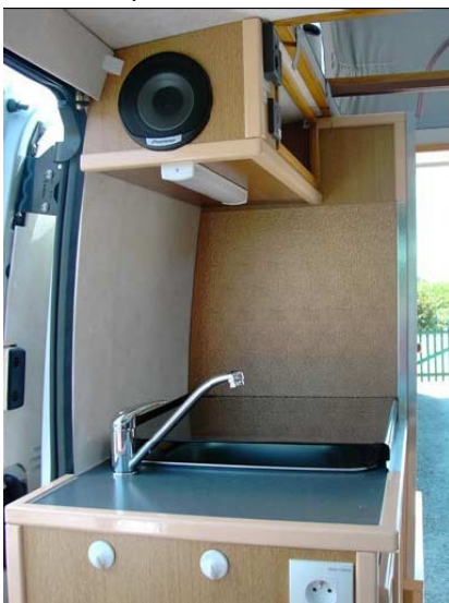
Evier – Cuisson

Bloc latéral droit L78xI54xh91cm avec combiné réchaud 2 feux et évier avec mitigeur ; le tout protégé par un abattant en verre. Prises 12 et 220 Volts. Réfrigérateur trimixte 60 litres. Rangements compartimentés sous le réchaud, incluant le chauffe eau: 42x40x52 et 26x29x78cm. Placard sous le frigo de 30x40x38cm. Au dessus, un tiroir et un rangement compartimenté de 31x49x38cm. Eclairage par réglette fluo. Aération par lanterneau et mini toit.