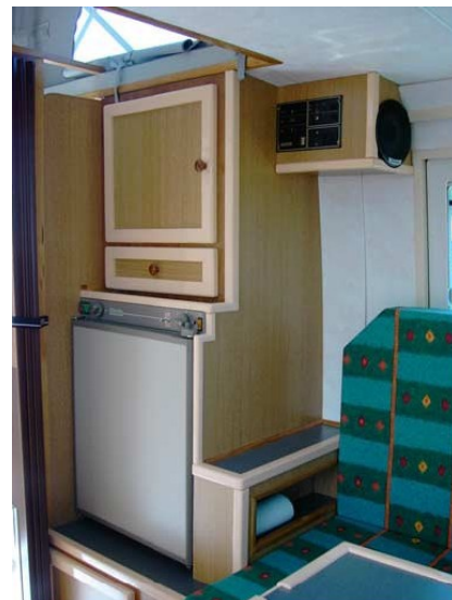
Frigo et rangements