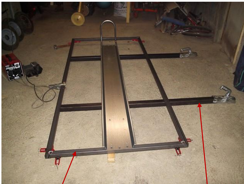
Cadre en 35x35 ép 2mm