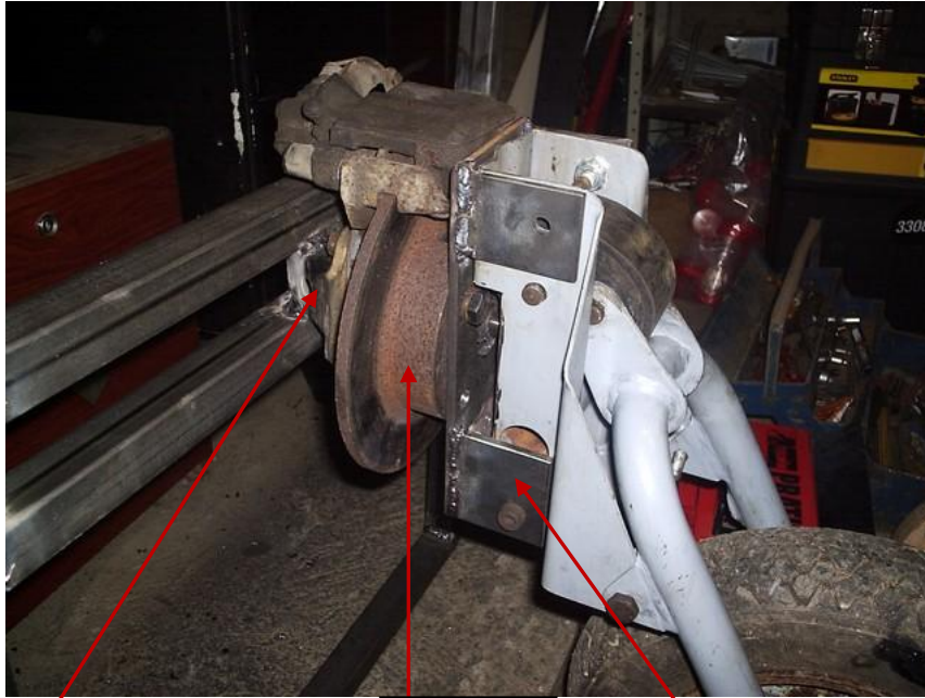
Tronçon de train arrière récupérer a la casse