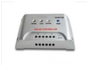
Régulateur de charge solaire MPPT 20A 12v/24v