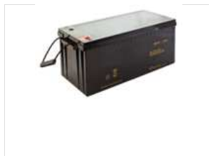
Batterie 12V 200AH AGM