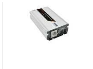
Convertisseur 12V-220V 2000W + USB 5V